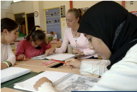
De Ark/ Gemiva